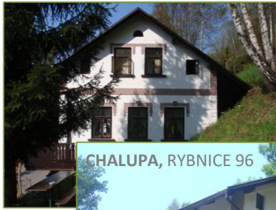
CHALUPA, RYBNICE 96